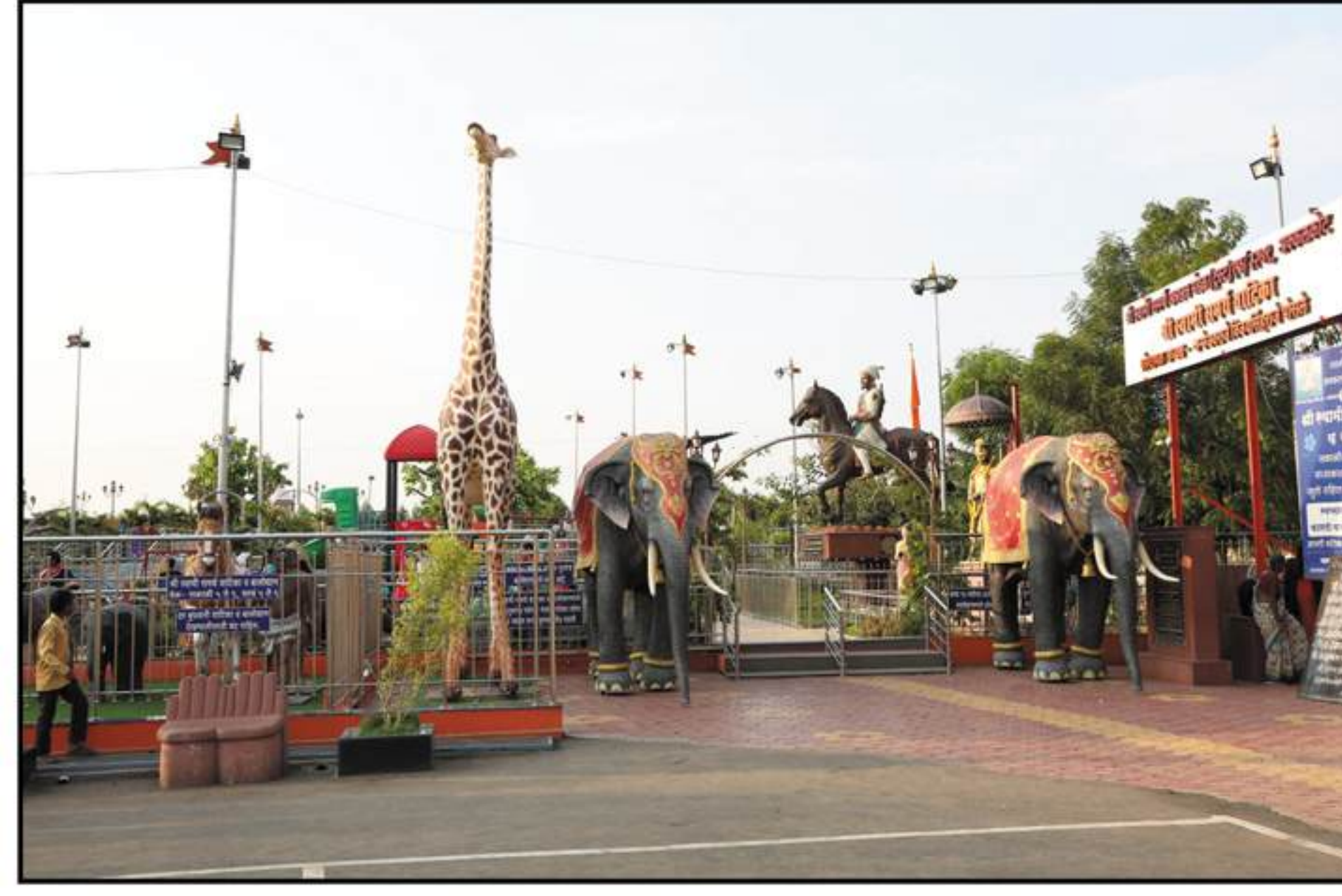
श्री स्वामी समर्थ वाटिका - बालोद्यान