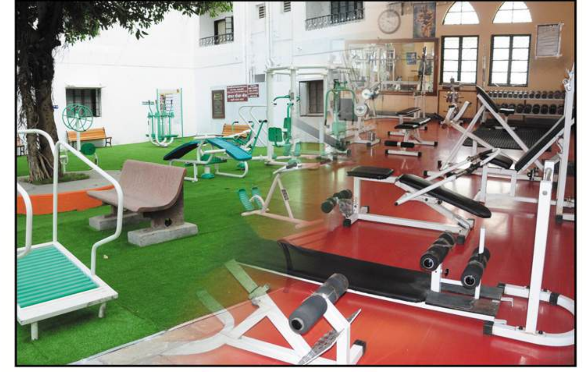
आऊटडोअर व इनडोअर जीम