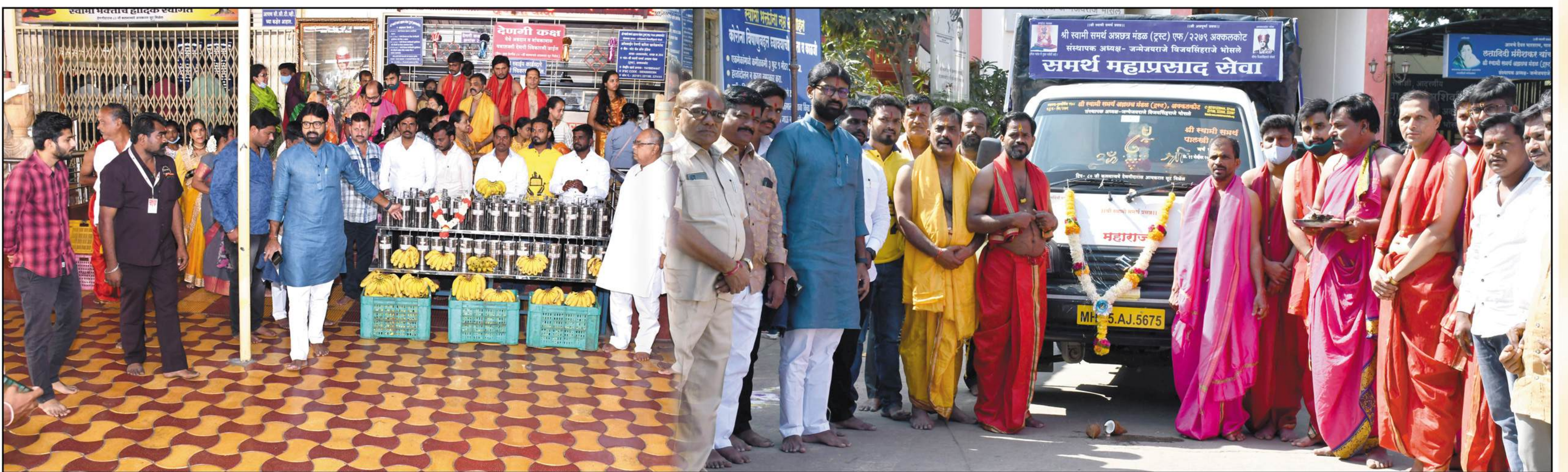
निराधारांसाठी "समर्थ महाप्रसाद सेवा"