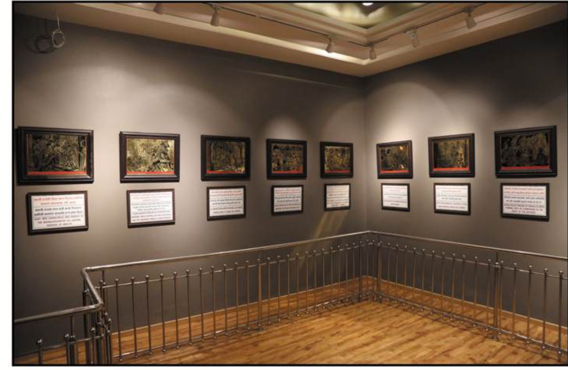
शिवचरित्र धातूशिल्प प्रदर्शन हॉल