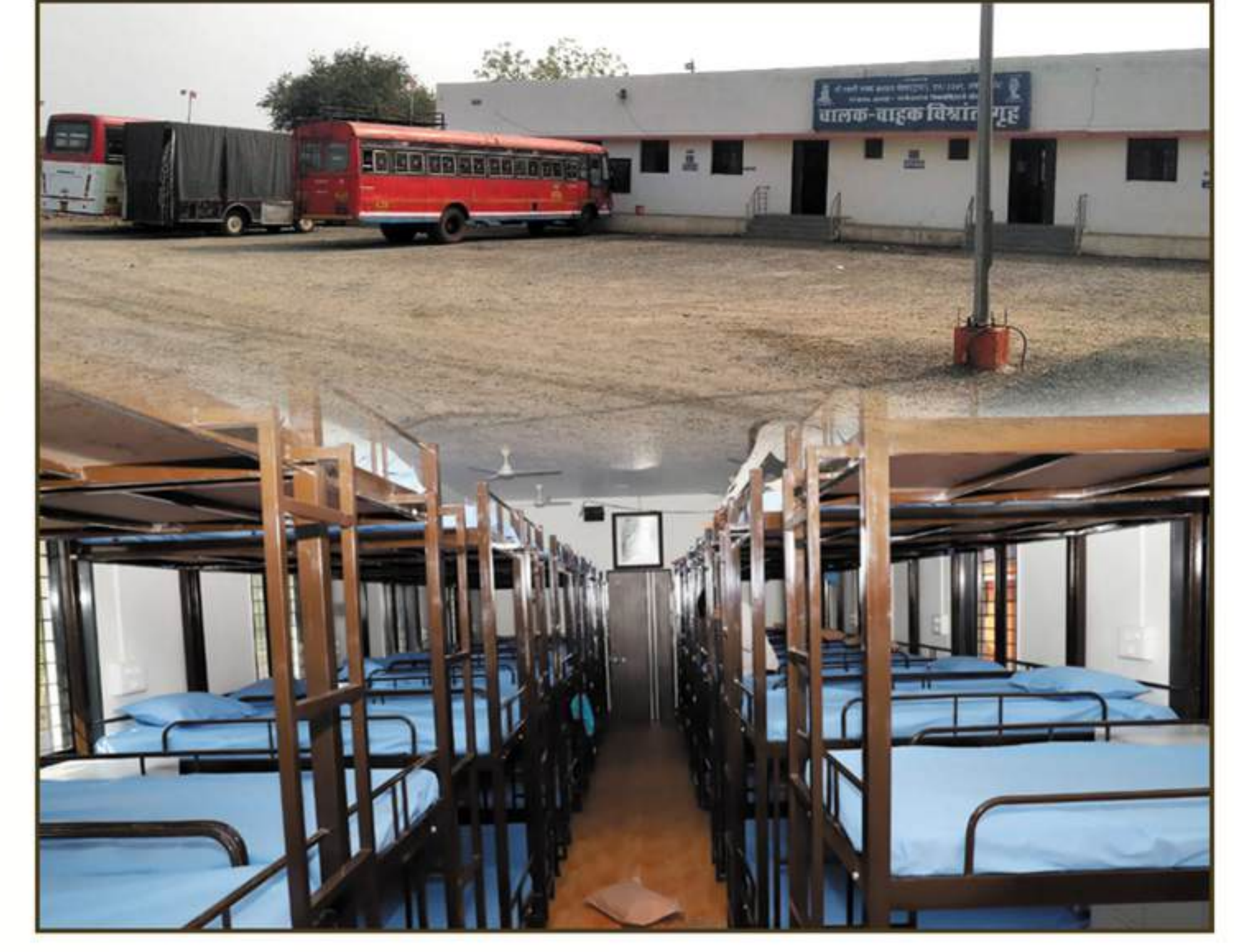
एस.टी. चालक-वाहकांसाठी विश्रांतीगृह