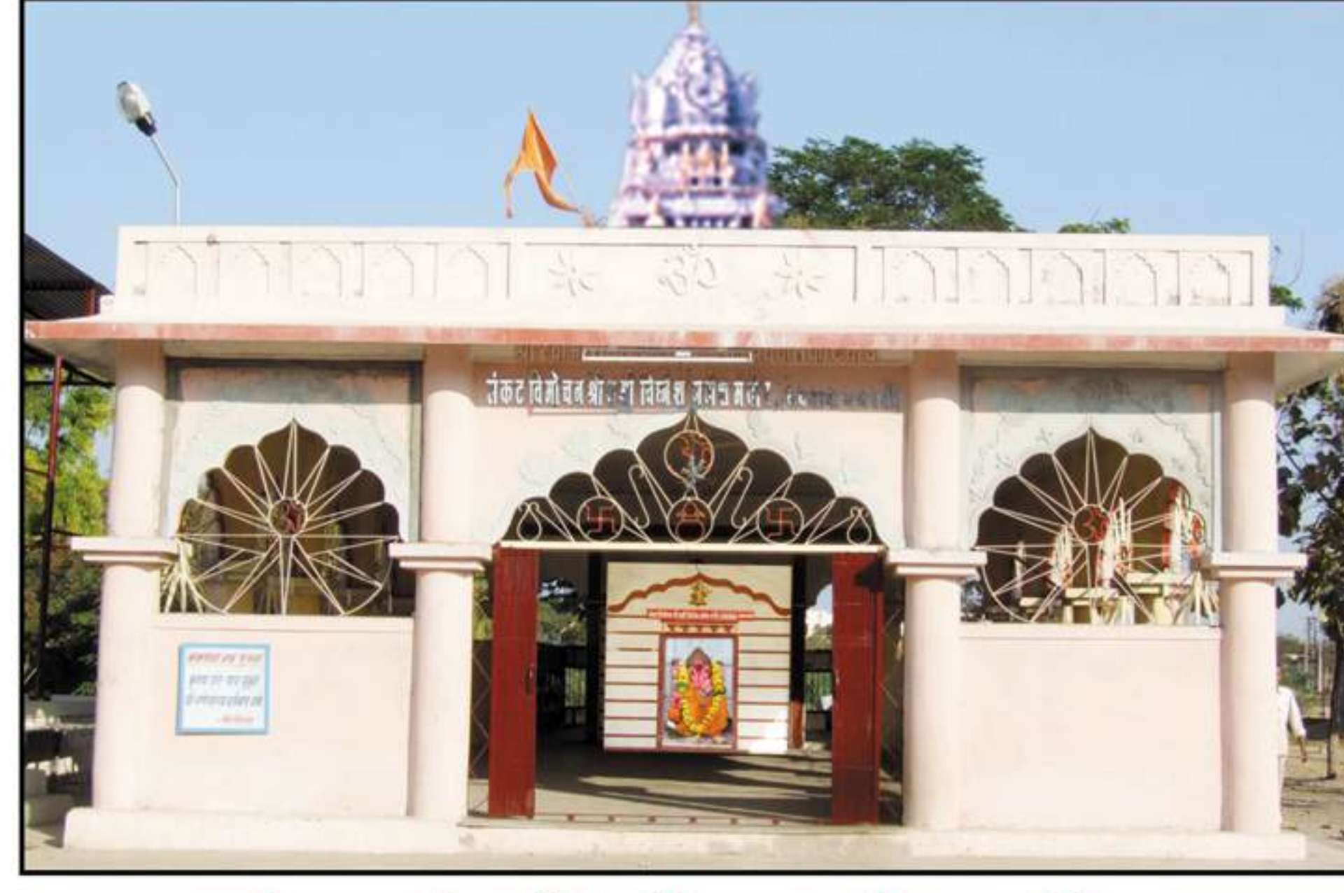
श्री शमी-विघ्नेश गणेश मंदिर (नवसाचा गणपती)