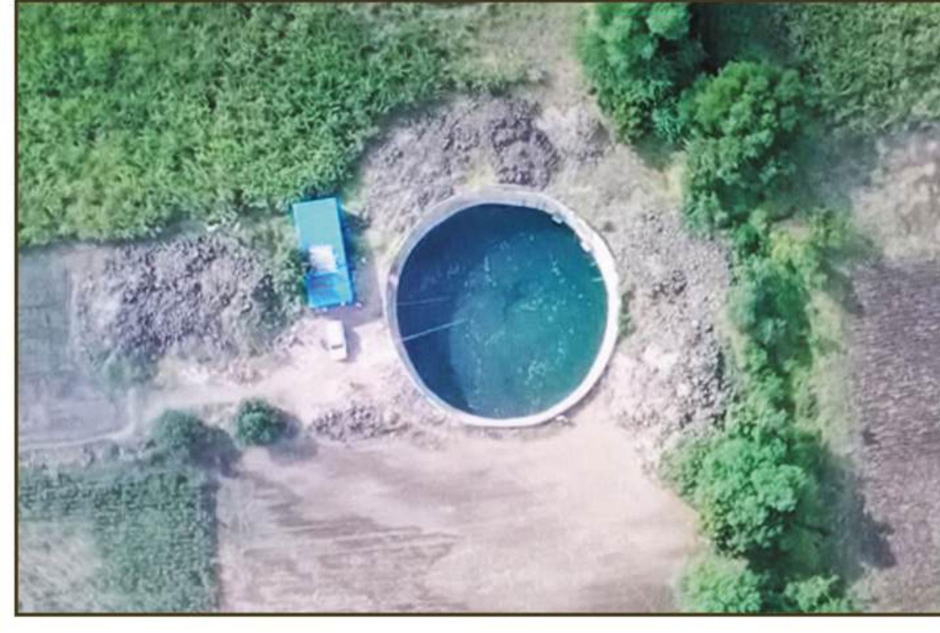
पाणी पुरवठ्यासाठी गळोरणी येथील विहीर