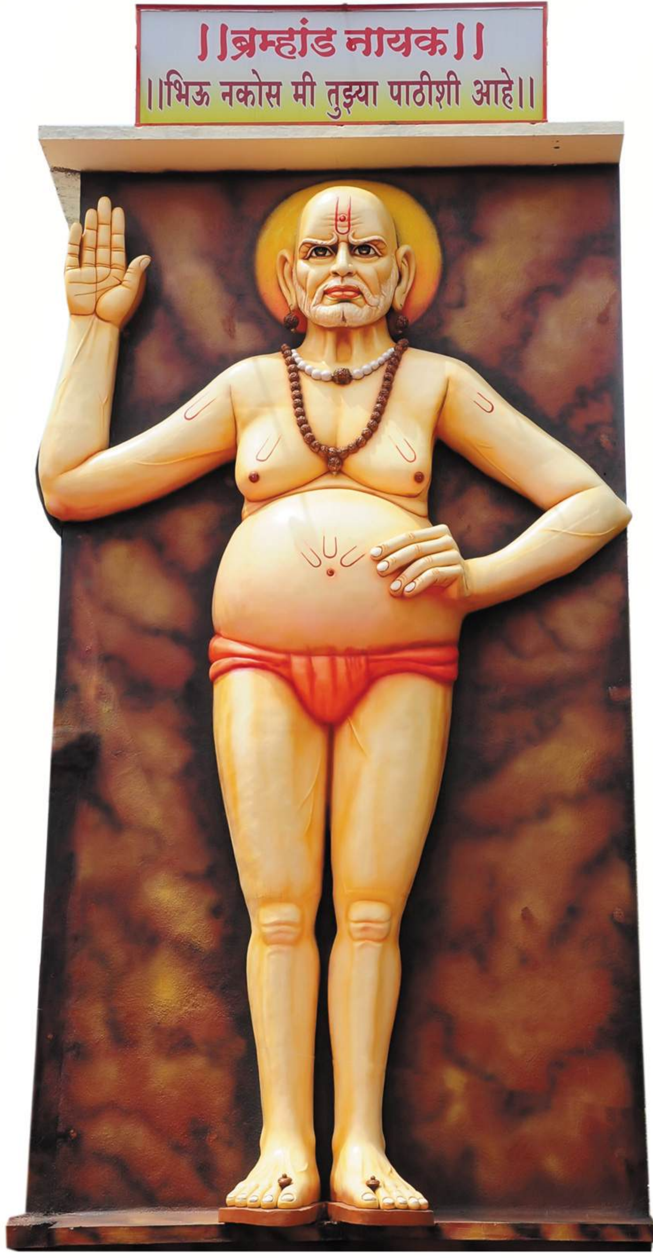
उभी स्वामी मुर्ती