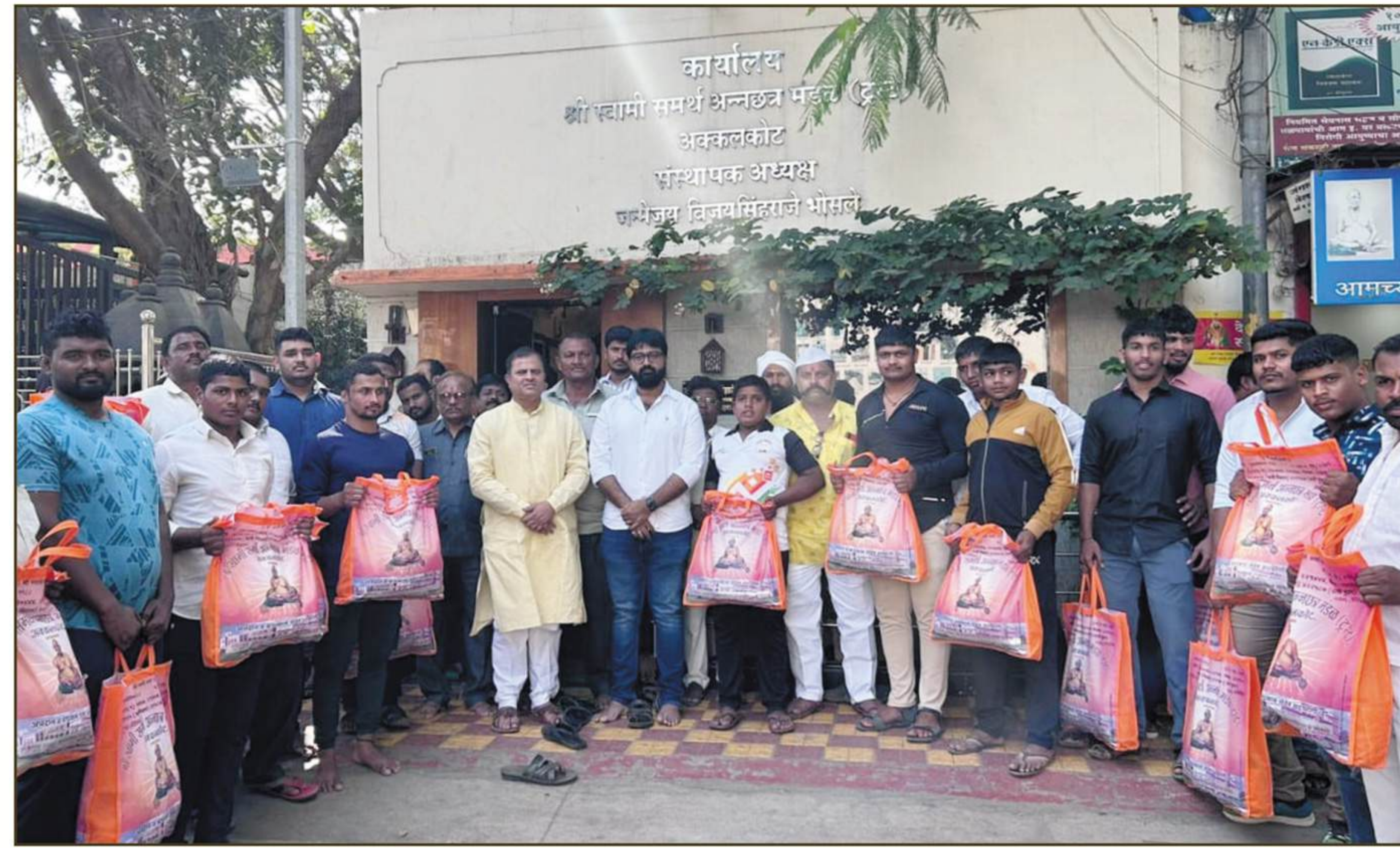
कुस्तीगीरांना दरमहा समर्थरुपी प्रसाद (खुराक)