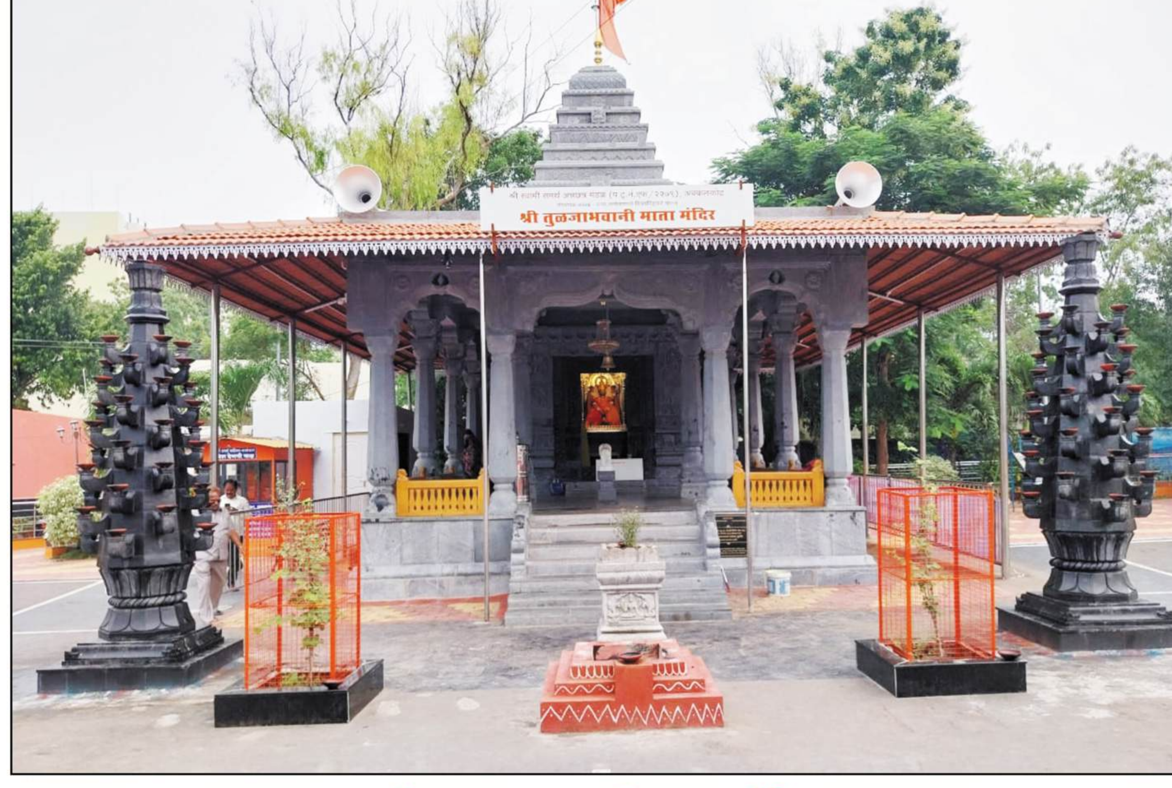
श्री तुळजाभवानी माता मंदिर